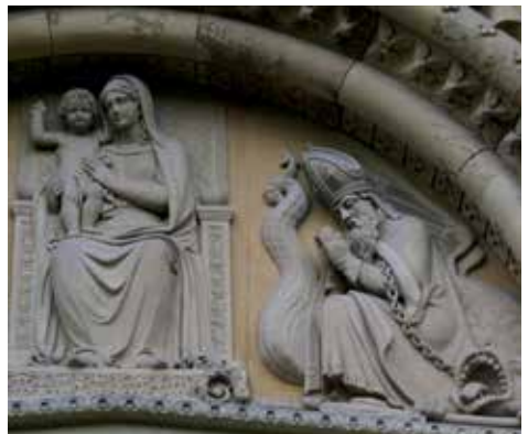
Ausschnitt aus dem Relief vom Portal der neuen St.-Servatius-Kirche in Güls mit Muttergottes und dem heiligen Servatius

Servatius starb nach der Legende am 13. Mai 384. Bevor er Bischof von Tongern wurde, nahm er 343 am Konzil von Sardika teil, wo er gegen den Arianismus eintrat. Der Arianismus gilt als Gegensatz zur gültigen Lehre des Athanasius, nach der Gott und sein Sohn Jesus Christus eins sind. Im Jahr 350 ging Servatius als Gesandter des Gegenkaisers Magnentius zu Kaiser Constantius II. in Edessa. Servatius starb in Maastricht, wo bis heute seine Reliquien verehrt werden. Stets ist der Bischof mit Krumm- oder Pilgerstab dargestellt. Da er den Arianismus bekämpfte, wird er zuweilen mit einem von ihm besieigten Drachen dargestellt.