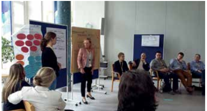
Die Koblenzer Kirche der Zukunft war Hauptthema der Beratungen

So bunt die Vielfalt der Menschen – haupt- wie ehrenamtlich – bei uns ist, so bunt und vielfältig sind natürlich auch die Interessen/Fähigkeiten des Plenums. Das kam der nächsten Aufgabe sehr zu Gute. Um der Klausurtagung eine Verbindlich-