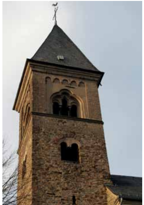
Turm der alten St.-Servatius-Kirche in Güls

In Güls („te Golse“), wo Servatius einen Wingert besaß, bestrafte er Kinder, die in großem Umfang Weintrauben gestohlen und den Weinberg verwüstet hatten. Er erschien den Kindern und ließ sie wie fest-