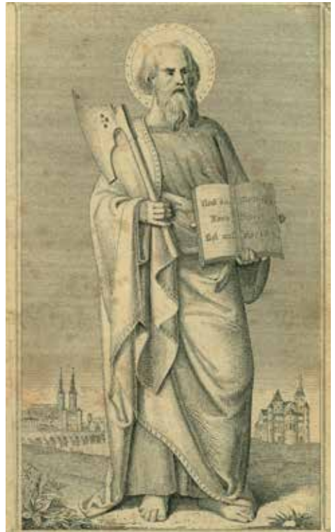
Der Heilige Matthias auf einem Heiligenbild der Koblenzer St.-Matthias-Bruderschaft, im Hintergrund Koblenz und der Trierer Dom

Kaiserin Helena und Bischof Agritius von Trier sollen die Reliquien des Apostels nach